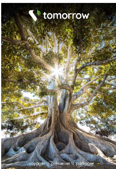
Visuel brochure 2022

Une nouvelle brochure Tomorrow, prévue pour la fin de l'année 2024, mettra en avant une sélection de voyages plus responsables, alignant ainsi l'offre de Marietton Développement avec les objectifs de durabilité.